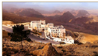
Hôtel à Petra *****