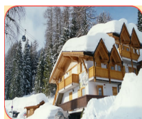
St Hubertus À côté de l'hôtel 2 pièces 4 pers. 1 sdb. 3 pièces 8 pers. 2 sdb.

Vous préférez loger en appartement mais vous souhaitez profiter des avantages du garni ? Pas de soucis ! Nous vous proposons des appartements de différentes capacités, à proximité immédiate de l'hôtel et gérés par le même propriétaire.