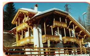
Belvédère à 350 m de l'hôtel 3 pièces 6 pers. 2 sdb